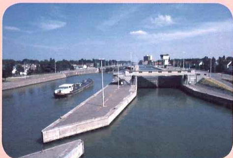
Wijnegem - Sluizencomplex op het Albertkanaal