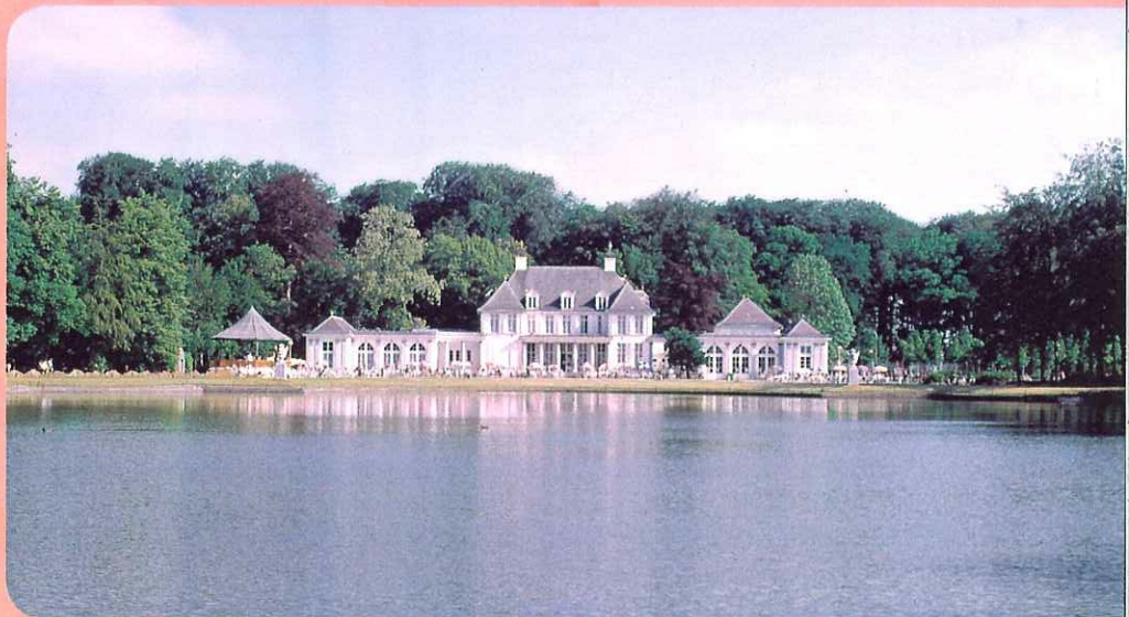
Provinciaal domein Rivierenhof