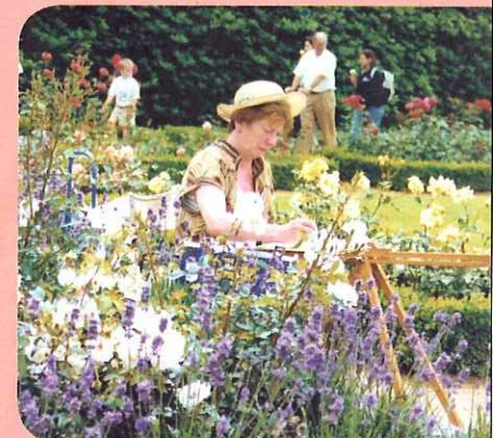
Deurne - Tuin van het Rivierenhof