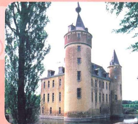
Kasteel van 's Gravenwezel