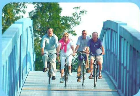
Fietsbruggen in het Scheldeland