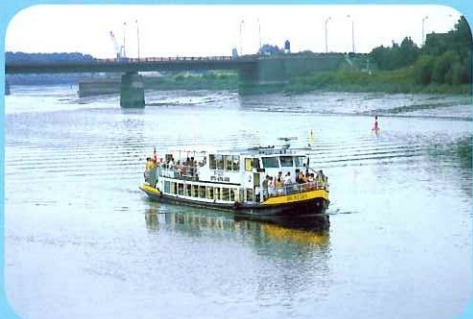
Boot op de Rupel