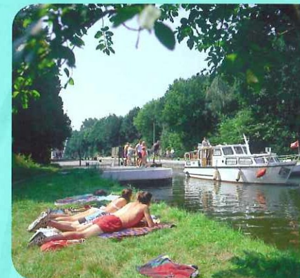
Zonneklopers langs het Kempens kanaal