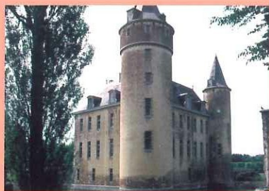
's Gravenwezel - Kasteel

bewegwijzerde themaroute Waterwegenroute (40 km)