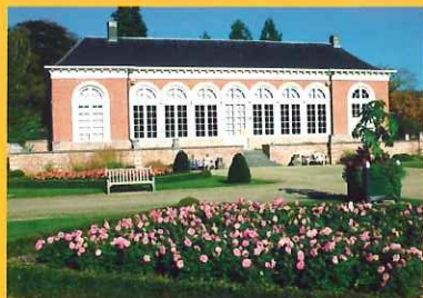
Schoten - Orangerie domein Vordenstein

bewegwijzerde themaroutes Kastelenroute (41 km) en Kapittelroute (38 km)