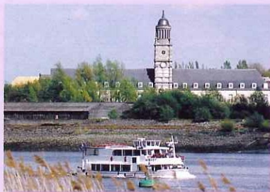
Hemiksem - Abdy en Schelde