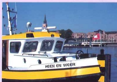
Boom - Veer naar Klein-Willebroek

bewegwijzerde themaroutes Baksteenroute (49 km) en Architectuurroute (37 km)