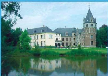
Malle - Kasteel de Renesse

De hele zomer lang wil ATV heel dicht bij u in de buurt blijven. Niet alleen op zondag, maar ook op maandag, want dan kan u genieten van onze ATV Vertelavond. Met grappige verhaaltjes en spelletjes van De Belgische Improvisatieliga brengt u samen met ATV in Oostmalle op 31 juli uw zomeravond door. Vergeet zeker niet uw eigen stoeltje mee te brengen. Fietsen doen we volgende week – 6 augustus – in Schoten.