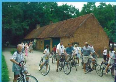
Zoersel - Boshuisje

bewegwijzerde themaroutes Conscienceroute (27 km) en Trappistenroute (44 km)