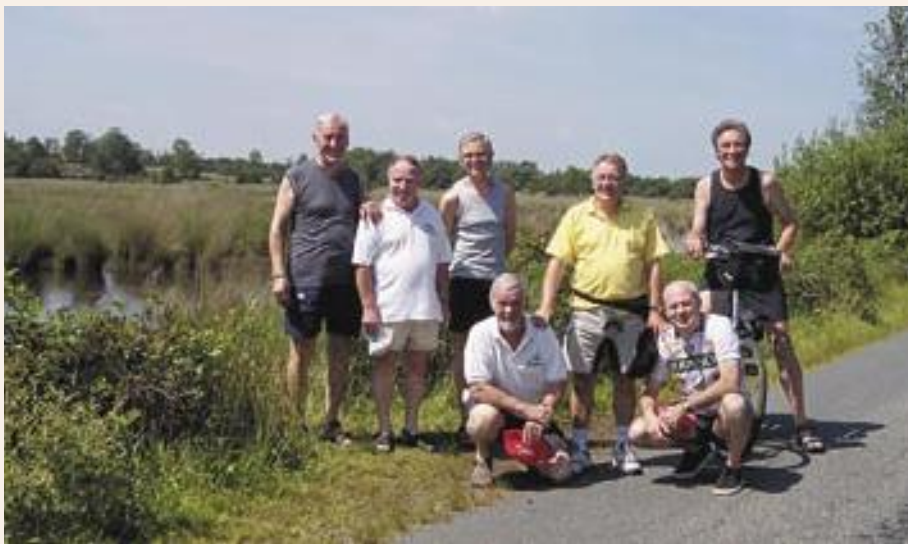
In het hartje van de Kalmthoutse Heide

zes gemeenten aanvatten. Wij opteren voor de schilderachtige omgeving van Brug 11 over de Schotense Vaart in Brecht. We vinden deze plek ideaal, omdat die het dichtst bij onze woonplaats in Sint-Antonius-Zoersel ligt, en omdat je er de wagen gemakkelijk kunt parkeren aan één van de twee horecazaken in de buurt: café Trapke Op of taverne De Goeien Tijd. Het is er bovendien erg rustig in deze omgeving, grenzend aan de Brechtse Heide. Je hebt bovendien een mooi uitzicht op de kanaalkom, waar een kleine jachthaven is gevestigd. Fietsen op het jaagpad langs de Schotense Vaart (officieel: het kanaal Dessel-Schoten) is een leuke bezig-