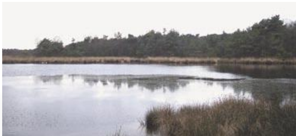
Groot ven in heidelandschap