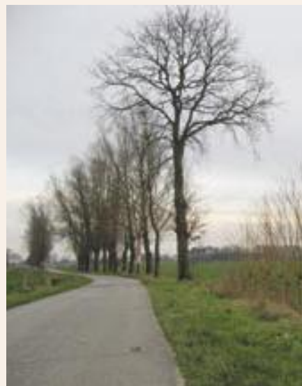
Landerijen in Essen

Zoals het bij een fietslus als deze past, kun je de tocht in elk van de