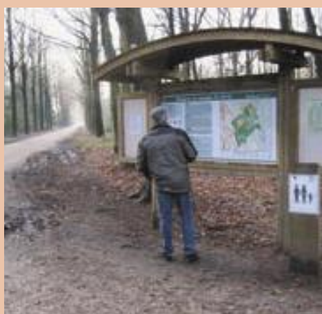
Ingang domein De Inslag

Zin in een prettige fietstocht van 70 kilometer? Dan stellen we in deze bijdrage graag een lus voor die zes gemeenten in de Antwerpse Voor- en Noorderkempen aandoet. Ontdek samen met ons de wondermooie "Noordertuin van Antwerpen", die zich uitstrekt over de gemeenten Brasschaat, Brecht, Essen, Kapellen, Kalmthout en Wuustwezel.