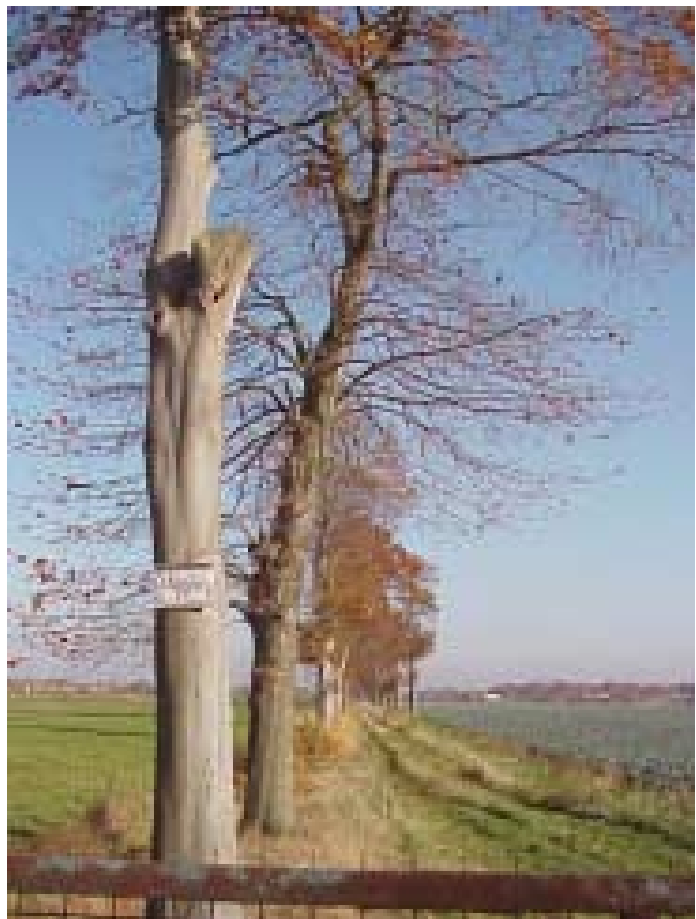
Beukendreef in Polderlandschap

Vanuit verschillende hoeken pleit men nu voor een nieuwe aanvoerweg van uit het oosten naar de A12 en de haven: de zogenaamde Nx (een gewestweg, voorlopig zonder nummering).